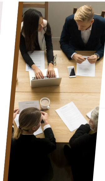
Docencia e investigación