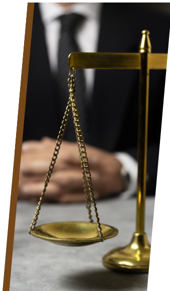
Despachos de abogados