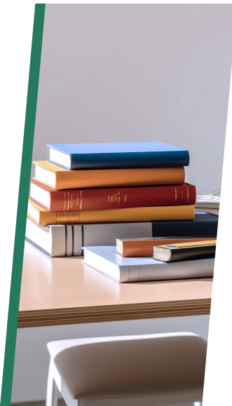
Desarrollo de material educativo