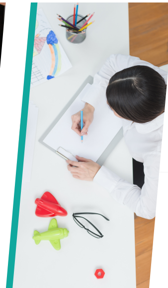
Consultoría y práctica privada